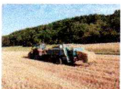
nc Foin paille botte carrée 90x120x220 en stock Machines de forage et de fondation