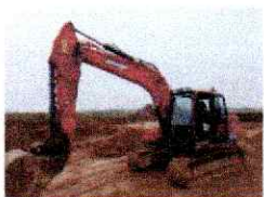
Doosan DX140LC-5 Pelles hydrauliques sur chenilles