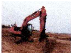
Doosan DX140LC-5 Pelles hydrauliques sur chenilles