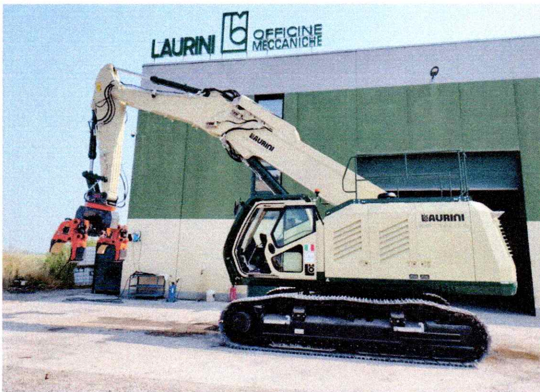
L'entreprise italienne a lancé pour l'occasion un modèle inédit de pelle de démolition, baptisée la Settanta.